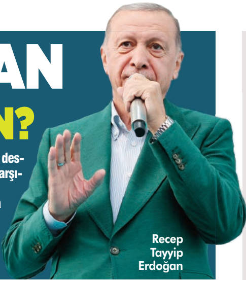
Recep Tayyip Erdoğan

selamladılar. Kandil'den gelen destek açıklamalarını alkışlarla karşıladılar. Şimdi kalkmışlar bize ahlak dersi, Cumhurbaşkanlığına milliyetçilik dersi vermeye çalışıyorlar. Sevsinler seni. Ya bay bay Kemal sen ne zaman milliyetçi oldun?" diye sordu.