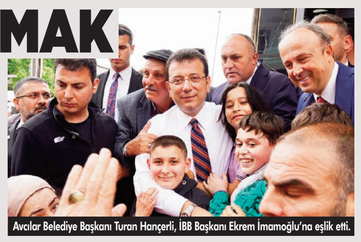
Avcılar Belediye Başkanı Turan Hançerli, İBB Başkanı Ekrem İmamoğlu'na eşlik etti.

İBB Başkanı Ekrem İmamoğlu, Avcılar Marmara Caddesi'nde vatandaşlara hitap etti. "Bazılar, sırf koltuğunu korumak için; fitneden, yalandan, fesattan, iftiradan geri durmuyor" diyen İmamoğlu, "Bizim insanlarımızı zehirliyorlar. Büyük günah. Af olmaz. Kul hakkı yemek, büyük günah. İftira atmak, büyük günah" eleştirisinde bulundu. 1 SAYFA 9