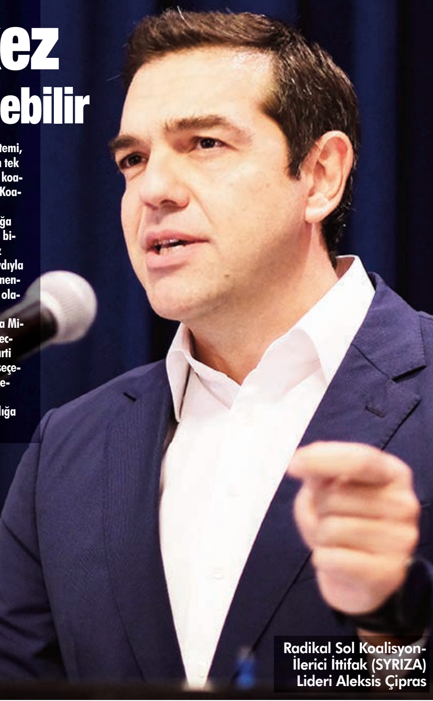
Radikal Sol Koalisyon-İlerici İttifak (SYRIZA) Lideri Aleksis Çıpras

Yunanistan'da 21 Mayıs'ta düzenlenen genel seçimlerde resmi olmayan sonuçlara göre Yeni Demokrasi yüzde 41'e yakın oy alarak (146 sandalye) en yakın rakibi SYRIZA'ya 20 puan fark atmıştı. SYRIZA, yüzde 20,07'lik oy ve 71 sandalyeyle ikinci sırada yer almıştı. Seçim yarışını üçüncü olarak tamamlayan PASOK-KINAL ittifakı ise yüzde 11,45'lik oyla 41 sandalyenin sahibi olmuştu. AA