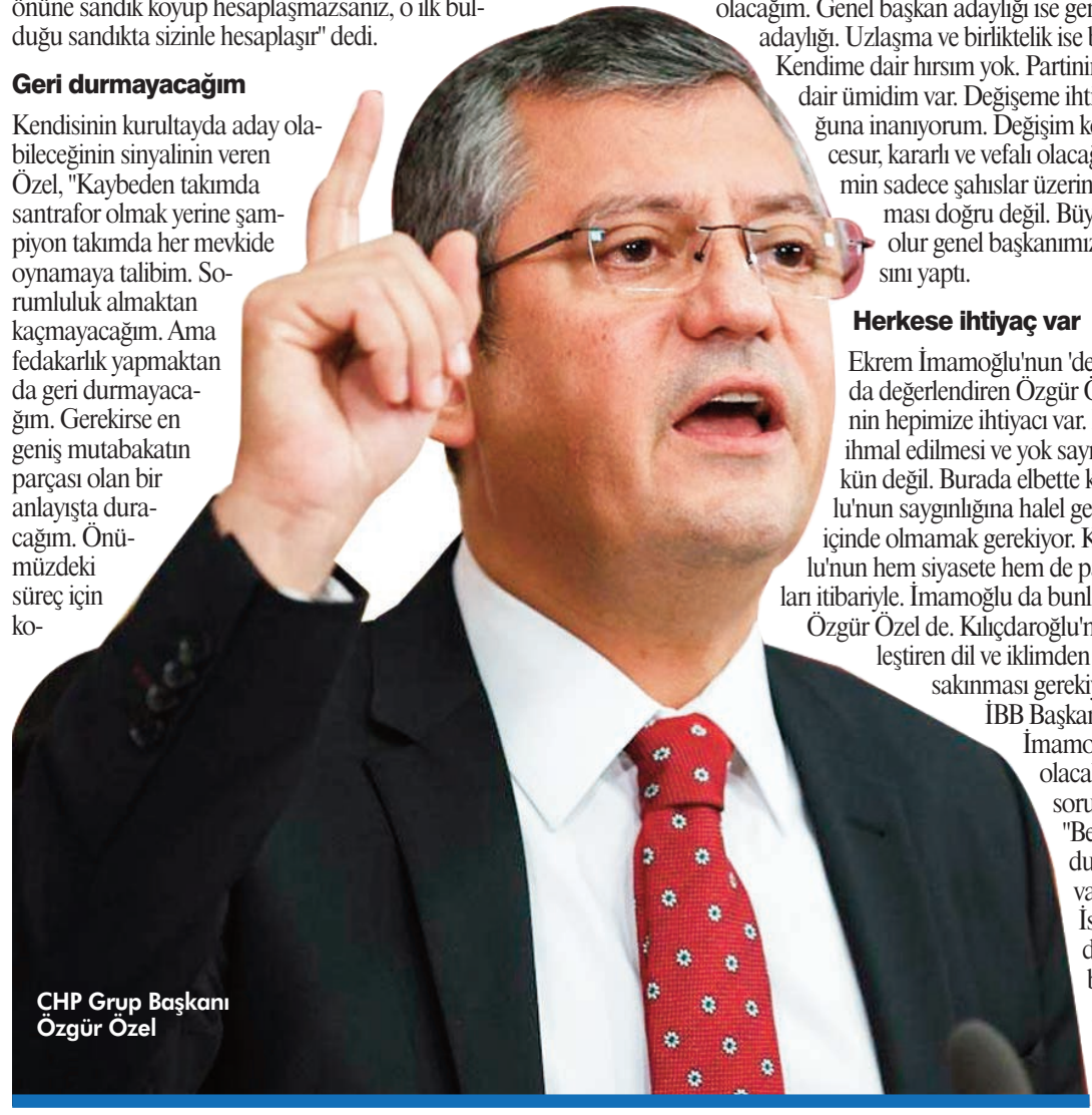
CHP Grup Başkanı Özgür Özel