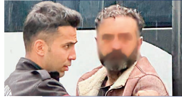
Site yöneticisinin polis olması bunu gösteriyor. Bir kere site yönetimi kendi arasında telefonla konuşmuyordu. Hep telsizle konuşma yapıyorlardı. Bizi buraya sokmak için ellerinden geleni yaptılar. Biz burada ne kameraya ne de başka bir şeye el koymadık. Burada üç sezonluk bir Netflix dizisi çıkar. 850'ye yakın mağdur var. Önceliğimiz bir kere bizden gerçek anlamda para vererek daire sahibi olan kişileri dairelerine kavuşturmak. Üzüntüden kanser olan daire sakinimiz var. O insanları daha fazla mağdur edemeyiz" açıklamasını verdi.

giñç yöntemler kullandığını belirterek, "Bundan beri buradaki çete üyelerinin işlerini çok profesyonelle yaptıklarını söylüyordum. Site yöneticisinin polis olması bunu gösteriyor. Bir kere site yönetimi kendi arasında telefonla konuşmuyordu. Hep telsizle konuşma yapıyorlardı. Bizi buraya sokmak için ellerinden geleni yaptılar. Biz burada ne kameraya ne de başka bir şeye el koymadık. Burada üç sezonluk bir Netflix dizisi çıkar. 850'ye yakın mağdur var. Önceliğimiz bir kere bizden gerçek anlamda para vererek daire sahibi olan kişileri dairelerine kavuşturmak. Üzüntüden kanser olan daire sakinimiz var. O insanları daha fazla mağdur edemeyiz" açıklamasını verdi.