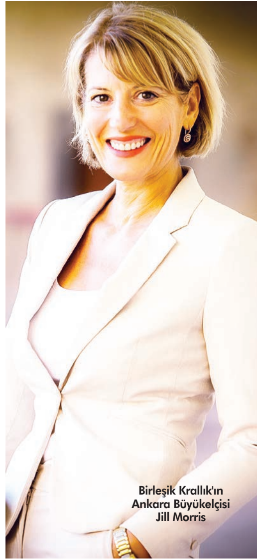
Birleşik Krallık'ın Ankara Büyükelçisi Jill Morris

bilmek için Türkiye'ye geldi. NATO mütefikimiz, G20 ortağımız ve hem iyi hem de kötü gün dostumuz olan Türkiye'nin yanında olmaya devam ediyoruz.