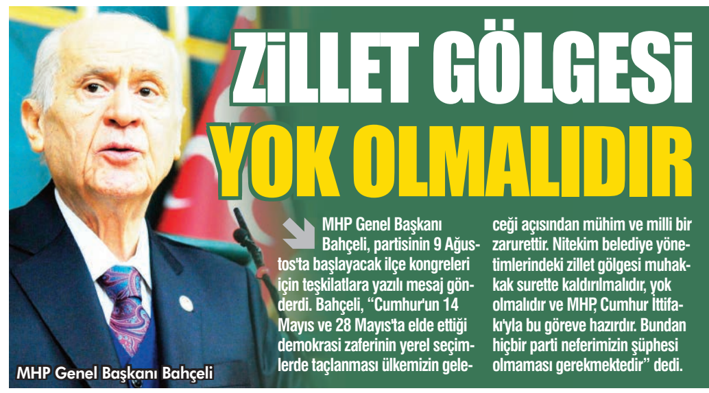
MHP Genel Başkanı Bahçeli