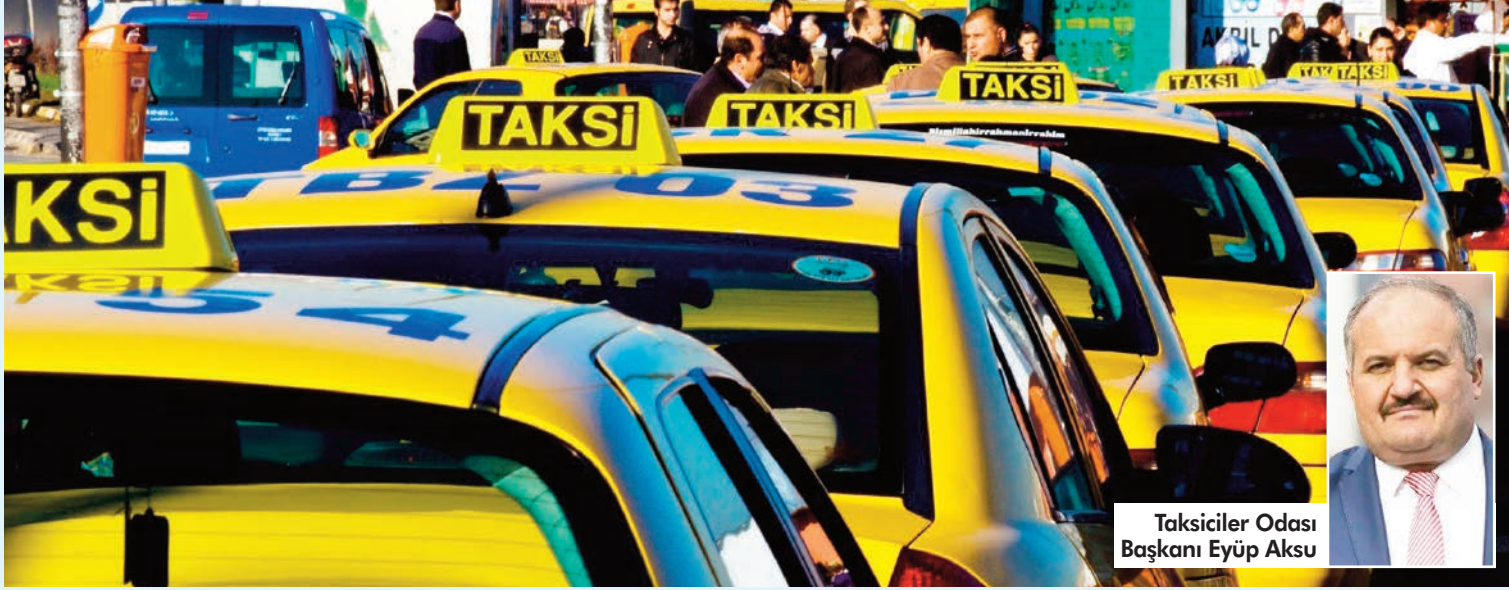
Taksiciler Odası Başkanı Eyüp Aksu

İstanbul'da Marmaray, metro, metrobüs, otobüs, minibüs, servis ve taksi ücretlerine yüzde 51,52 oranında zam yapıldı. Tam bilet ücreti 15 TL oldu. Taksi ağırlık ücretine ise yüzde 75 zam yapılarak 40 TL'den 70 TL'ye çıkarıldı. Zamları yetersiz bulduklarını anlatan Taksiciler Odası Başkanı Eyüp Aksu karara tepki göstererek salonu terk etti. Aksu, "Taksici esnafı olarak bu tarifeleri kesinlikle kabul etmiyoruz. Bütün esnaf grubu kontak kapatabiliriz" dedi