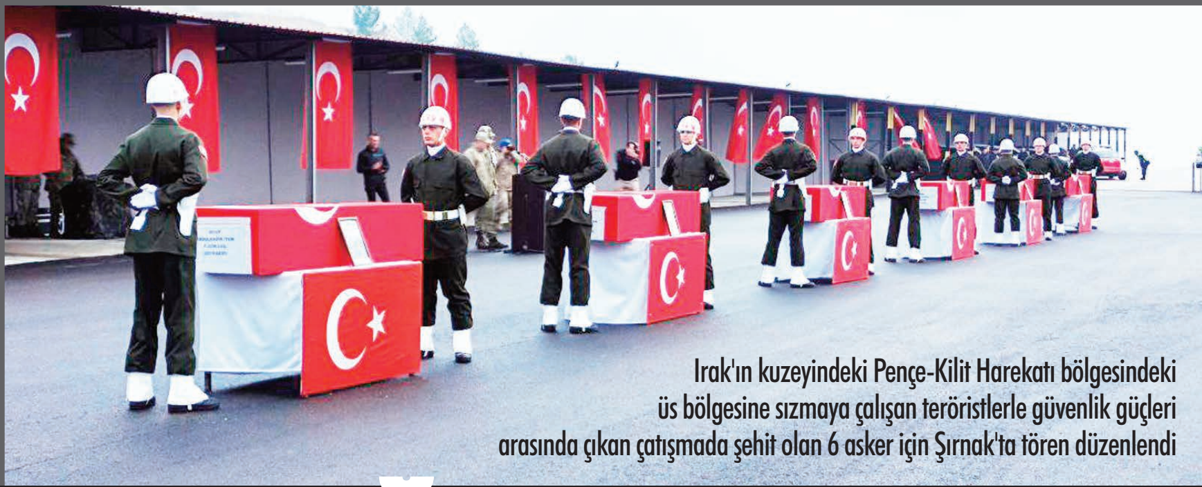
Irak'ın kuzeyindeki Peñe-Kilit Harekatı bölgesindeki üs bölgesine sızmaya çalışan teröristlerle güvenlik güçleri arasında çıkan çatışmada şehit olan 6 asker için Şırnak'ta tören düzenlendi