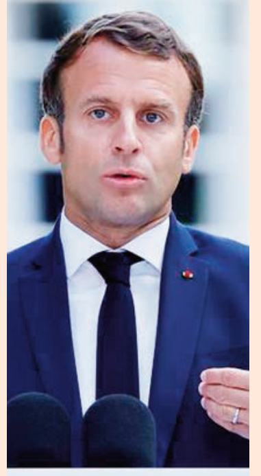
Fransız Cumhurbaşkanı Emmanuel Macron

Fransız liderin, İsrail'in, Yahudi yerleşimcilerin Filistinli sivillere yönelik şiddetine ve Batı Şeria'da yeni yerleşim projelerine son vermek için gerekli önlemleri alması gerektiğini vurguladığı aktarılan açıklamada, bu durumun iki devletli çözümü tehdit ettiği değerlendirilmesine yer verildi. Açıklamada, Cumhurbaşkanı'nın, ülkesinin çatışmanın bölgeye sıçramasını engellemek için İran ve ona bağlı gruplara çatışmadan