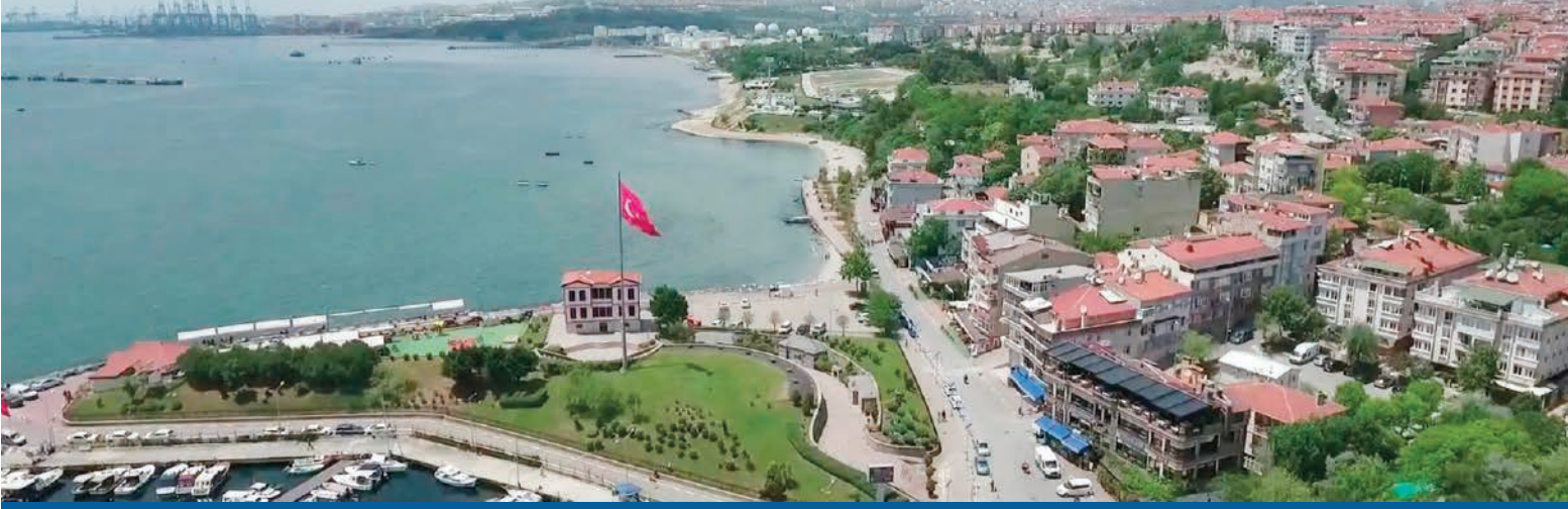
Avcılar'da 'kayan bölge' olarak ilçe sakinleri tarafından sıkça konu edilen Ambarlı Mahallesi'nde bile 15 bin liranın altında kiralık daire bulabilmek mucize gibi. Ambarlı'da kentsel dönüşümüne girip yeniden inşa edilen binalardaki kiralık dairelerin fiyatları ise 22 bin liradan başlıyor.

yatlarının neden bu kadar arttığını anlatan Emlakçı Çağatay Yolcu ise "Şehir çok göç aldı. Özellikle yabancıların gelişmesiyle kiralar ciddi anlamda arttı. Yabancı da para var. 12 bin lirayı, 20 bin lirayı kolaylıkla verebiliyor. Ama Türkiye şartlarında bu rakamlar bir emekli için asgari ücretli için büyük külfet demek. O yüzden fiyatlara düzenleme getirilmesi şart" şeklinde konuştu.