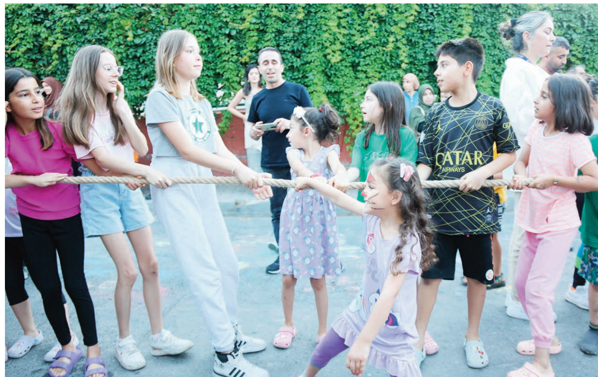
Etkinliğe katılan çocuklar, sek sek, halat çekme, evet-hayır oyunu, çuval yarışları oyunlarında gönüllü olarak eğlendi. Yüz boyama standı önünde uzun kuyruklar oluşturan çocuklar, bol bol fotoğraf çektirerek, eğlence dolu günü ölümsüzleştirdi.

Küçükçekmece Belediyesi, "Sokakta Oyun Var" etkinliği ile unutulmaya yüz tutmuş sokak oyunlarını çocuklarla buluşturdu. İnönü Mahallesi Sarıgül Sokak'ta ilki gerçekleştirilen etkinlikte, çocuklar birbirinden eğlenceli oyunlar oynadı